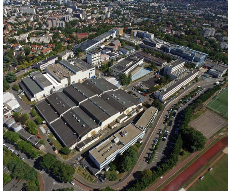
Vue aérienne du CEA/Fontenay-aux-Roses.