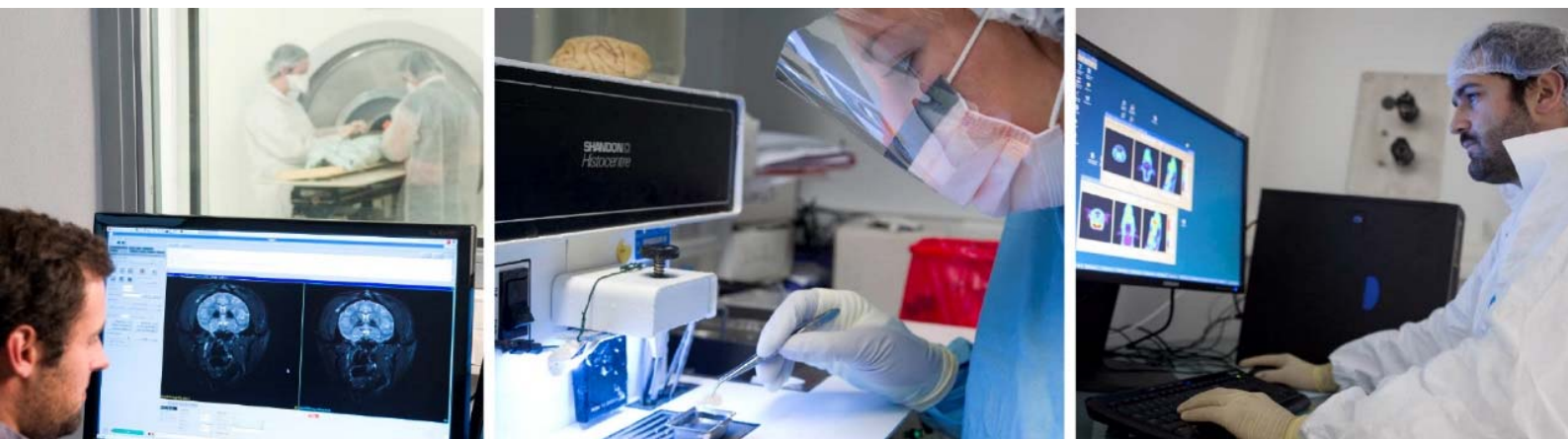
De gauche à droite : IRM 7 Teslas du cerveau en recherche préclinique, MIRCCen/CEA/Inserm ; étude immunologique dans un laboratoire de haute sécurité microbiologique, CEA/IDMIT ; imagerie TEP en recherche préclinique, MIRCCen/CEA/Inserm. © P.Stroppa / CEA - C. Dupont / CEA