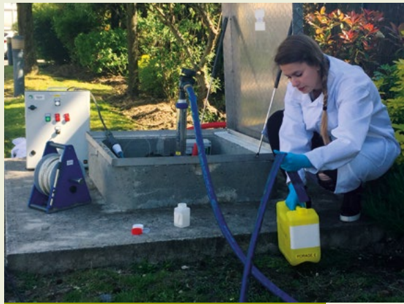
Prélèvement d'eau dans la nappe souterraine.

Le sous-sol du site de Fontenay-aux-Roses possède une spécificité : il existe, au-dessus de la nappe phréatique, une nappe dite « perchée » située à 65 mètres de profondeur. Cette nappe et ses résurgences font l'objet d'une