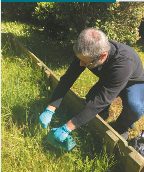
Prélèvement d'herbe pour mesure de la radioactivité en laboratoire.

Le site de Fontenay-aux-Roses prélève mensuellement des végétaux dans quatre stations de surveillance situées à Bagneux, Clamart et Fontenay-aux-Roses. Les analyses réalisées sur ces échantillons portent sur la recherche de radionucléides d'origine artificielle, comme le césium 137 et l'américium 241. En raison des très faibles rejets gazeux des INB, aucune activité ne peut être détectable dans les végétaux. Comme les années précédentes, les résultats 2017 ne font apparaître aucune trace de radioactivité artificielle. La radioactivité de la végétation, d'origine naturelle, est due à la présence principale dans le végétal de deux radionucléides : le potassium-40 présent dans les sols et le béryllium-7 d'origine cosmique.