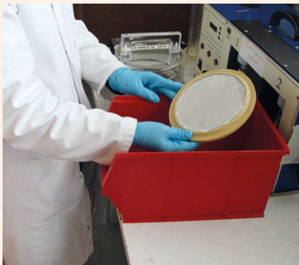
Les aérosols sont prélevés sur des filtres qui sont ensuite analysés.

Le site de Fontenay-aux-Roses surveille toute variation anormale de la radioactivité dans l'air, qui pourrait être due à la présence d'aérosols ou d'halogènes générés par les activités du centre. En 2017, les mesures effectuées dans ses laboratoires d'analyses donnent des valeurs généralement inférieures à 1 \text{ mBq/m}^3 , provenant de la radioactivité naturelle.