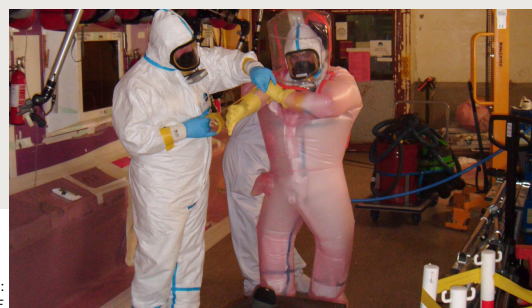
Démantèlement de la chaîne blindée Candide : habillage avant entrée en zone

Le CEA/Fontenay-aux-Roses a accueilli le premier réacteur nucléaire français (Zoé) ainsi que les premiers laboratoires de recherche dans le domaine de la fission, de la fusion, de l'étude des combustibles, du traitement du combustible nucléaire usé ou encore du conditionnement des déchets. La fin des opérations d'assainissement et de démantèlement est prévue à l'horizon 2057.