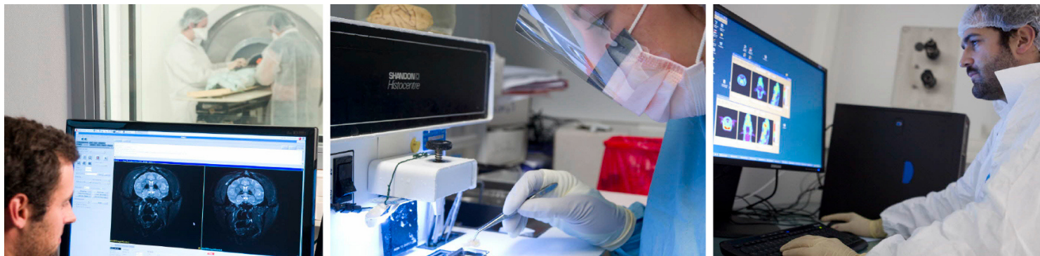
De gauche à droite : IRM 7 Teslas du cerveau en recherche préclinique, MIRcen/CEA/Inserm ; étude immunologique dans un laboratoire de haute sécurité microbiologique, CEA/IDMIT ; imagerie TEP en recherche préclinique, MIRcen/CEA/Inserm.