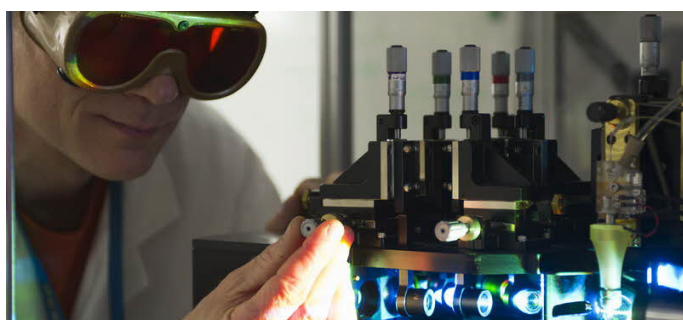
Réglage d'un trieur de cellules en flux, IRCM.

Le département IRCM (Institut de Radiobiologie Cellulaire et Moléculaire) travaille sur les réponses cellulaires aux rayonnements ionisants et à certains toxiques (nanoparticules, perturbateurs endocriniens...). Les chercheurs s'intéressent particulièrement à la réponse des cellules-souches ainsi qu'aux mécanismes de transmission des dommages créés par l'irradiation et à leurs conséquences sur le long terme. Leurs travaux participent de la recherche sur le cancer et trouvent des applications dans l'amélioration des protocoles de radiothérapie et de radioprotection