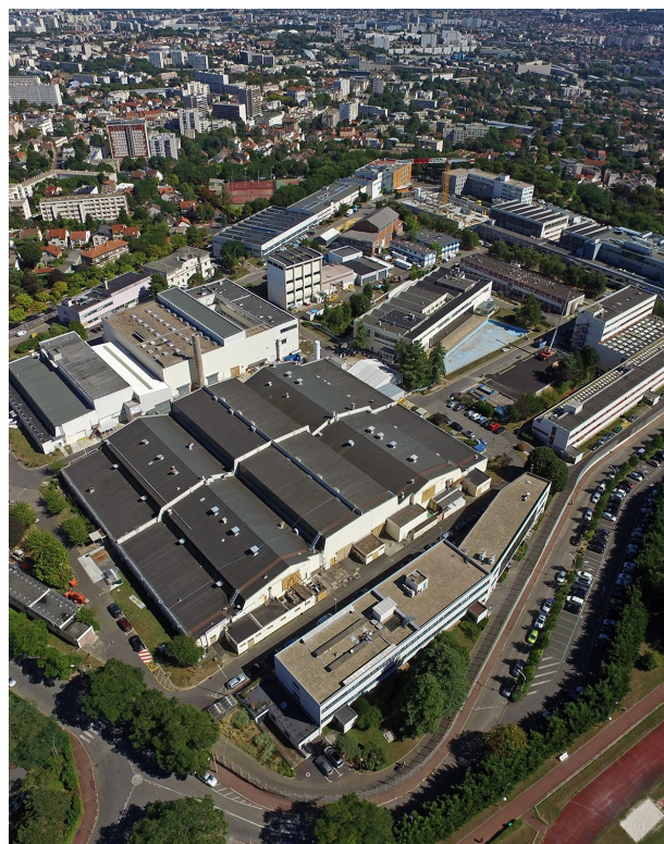
Vue aérienne du CEA/Fontenay-aux-Roses.